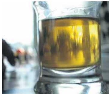
RINNER NED. Konsumtionen av skotsk whisky ökar kraftigt i bland annat Kina.