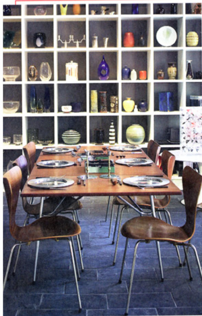
Det finns oändligt många vackra saker att titta på hos Modernity.