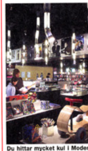
Du hittar mycket kul i Modernas butik.

Butiken Moderna museet, Skeppsholmen, telefon 08-518 552 21.